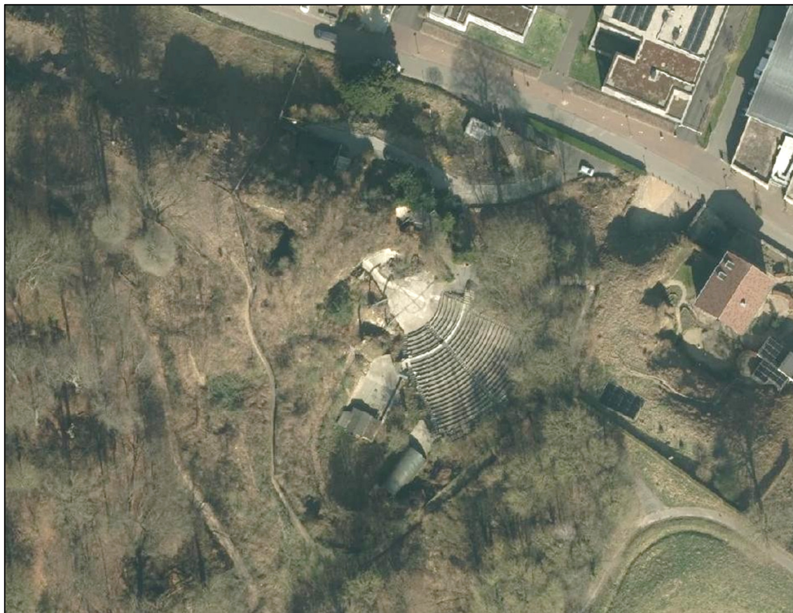
Figuur 2: Luchtfoto van het plangebied 2025 in de winterperiode (satelietdataportaal.nl). De tribune en het podium zijn goed zichtbaar.

Het openluchttheater in de gemeente Valkenburg is het oudste openluchttheater van Nederland. Het theater werd ruim 100 jaar geleden gebouwd waarbij in de rotswand een tribune werd uitgehouwen voor 1200 bezoekers. In 1916 werd het theater in gebruik genomen. Medio jaren '70 is het theater gesloten door teruglopende bezoekersaantallen. In 1983 werd het theater gerestaureerd en twee jaar later werden de eerste voorstellingen weer gegeven. Behalve het openluchttheater is er een Grottheater voor intieme en overdekte voorstellingen voor maximaal 100 bezoekers. In deze oriëntatie worden het openluchttheater en het Grottheater aangeduid als theatercomplex. Jaarlijks weten ruim 25.000 bezoekers het theatercomplex in Valkenbrug te vinden.