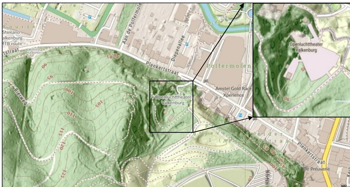
Figuur 1: Ligging Openluchttheater in Valkenburg (Limburg Atlas, 2026).

In dit document wordt de voortoets uitgewerkt.